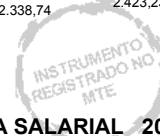
TABELA SALARIAL 2017-2018